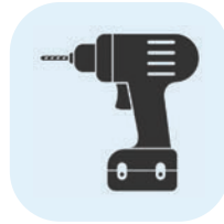
DISPOSITIVOS DEL GARAGE