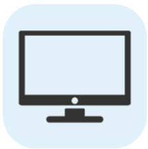
TVs & ACCESSORIES