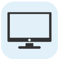
TELEVISORES Y COMPLEMENTOS