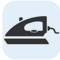
DISPOSITIVOS DEL HOGAR