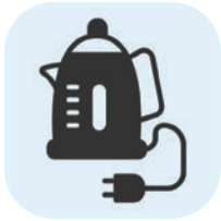
DISPOSITIVOS DE COCINA