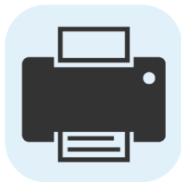
COMPUTADORAS Y COMPLEMENTOS