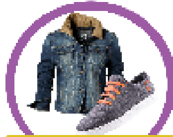
เสื้อผ้ามือสองใช้น้อยครั้ง