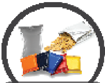
ลูกอมและกระดาษห่อขนมขบเคี้ยว