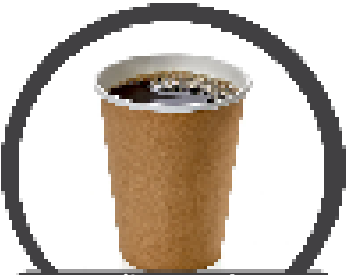
ถ้วยกาแฟ (วัสดุกำจัดได้)