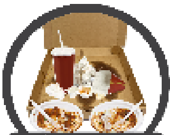
จานที่หุ้มกล่องอาหารกระดาษห่อ ขนมขบเคี้ยว