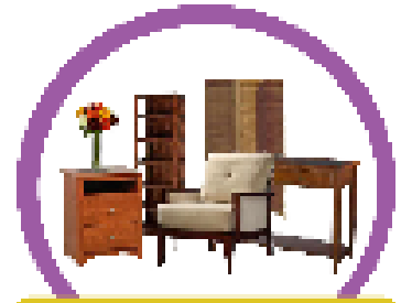
เฟอร์นิเจอร์มือสองใช้น้อยครั้ง