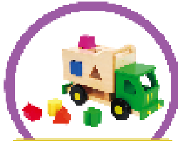
ของเล่นมือสองใช้น้อยครั้ง