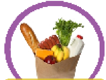
อาหารที่กินได้