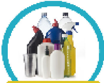
พลาสติกที่ระบุเบอร์ 1-7