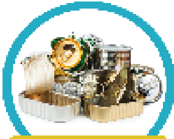
โลหะและกระป๋อง