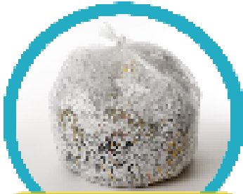
กระดาษฟอย