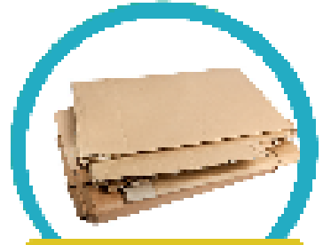
กระดาษแข็งแบน