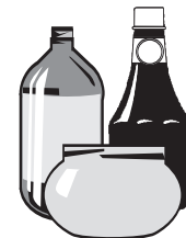
Glass Bottles and Jars