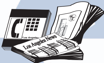
Newspaper, Magazines, Phone Books, Envelopes, and all CLEAN Paper