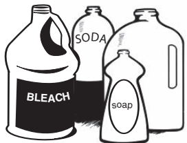
Plastic Dinnerware, Containers, Bottles, Tubs, Jugs, and Jars

Recycle Only These Clean Items: Recicle Esto's Artículos Limpios Solamente: