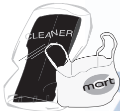
Plastic Bags and all Clear Film Bags